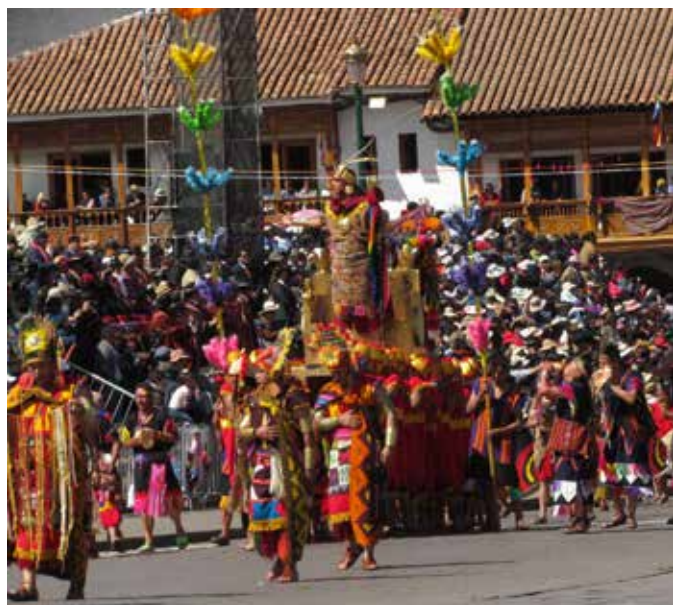
Intiraymi el INCA.

Quando il sole scaccia le nubi, scortati da un'ottima guida visitiamo la città. Al pomeriggio, visto che abbiamo ancora un po' di tempo, alcuni di noi decidono di salire in vetta al Machu Picchu che domina la valle: si tratta di 600 m di dislivello in poco più di un km e mezzo, per lo più su alti gradini; ci tocca tenere una andatura veloce perché a una certa ora chiudono e arrivo col fiatone e il cuore in gola, ma il panorama che si apre sulla valle e sulla città è una ricompensa più che adeguata. Scendiamo, una meritatissima chicha, e inizia il rientro che in due giorni ci riporterà a casa.